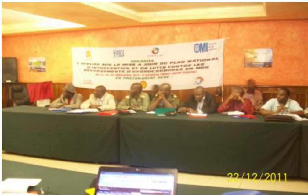
Travaux de groupes