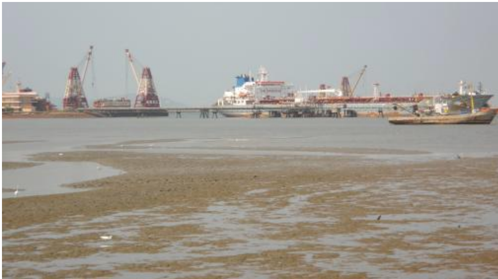
Une vue du port de Conakry