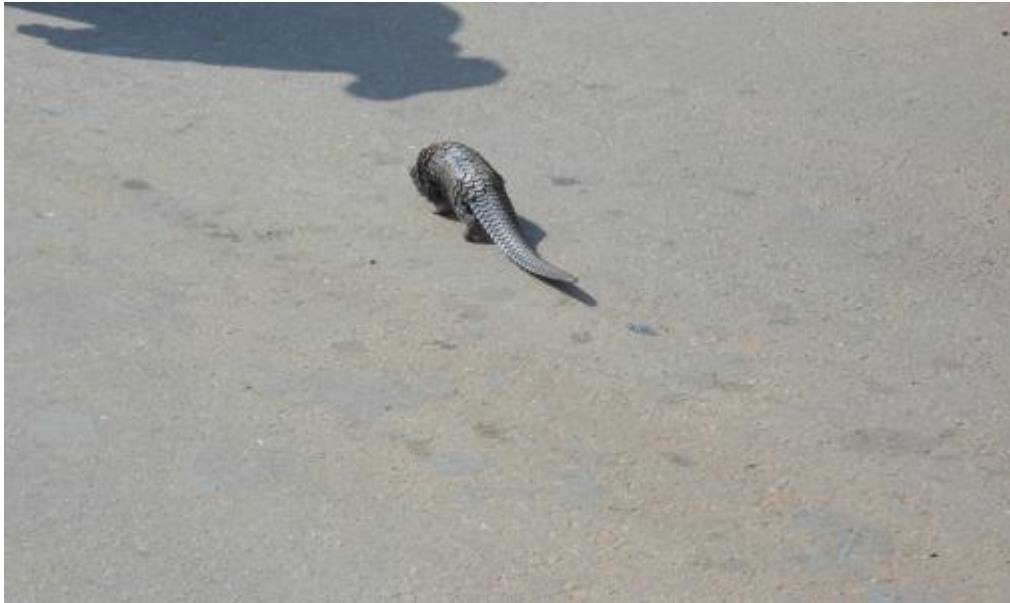
Un « participant » sensible à protéger lors d'une pollution marine