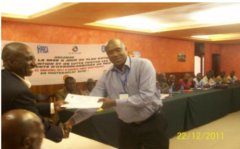
Remise d'un certificat par le Secrétaire Général du Ministère Délégué à l'Environnement et aux Eaux et Forêts