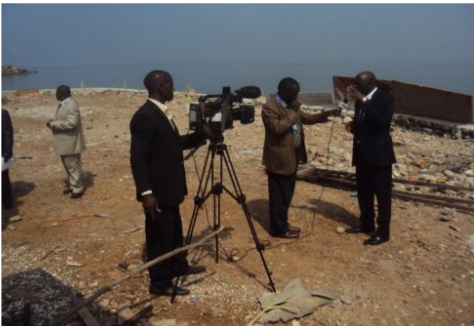
Interview du Ministre Délégué à l'Environnement et aux Eaux et Forêts