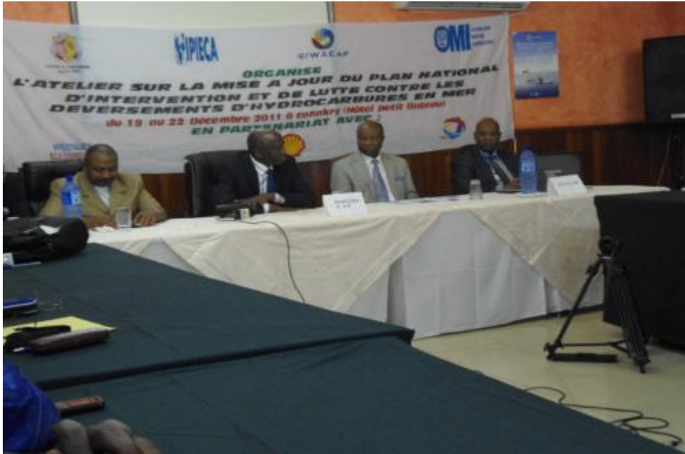
Cérémonie d'ouverture par le Ministre Délégué à l'Environnement et aux Eaux et Forêts