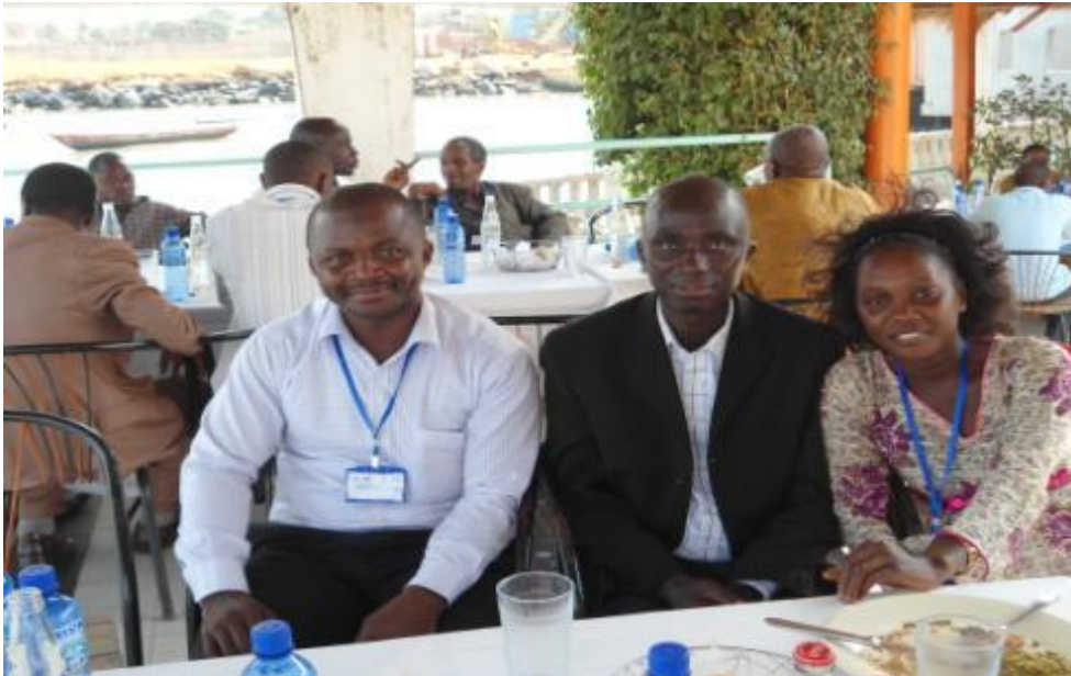
La pause déjeuner